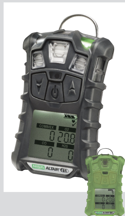
K dispozici svítivé pouzdro